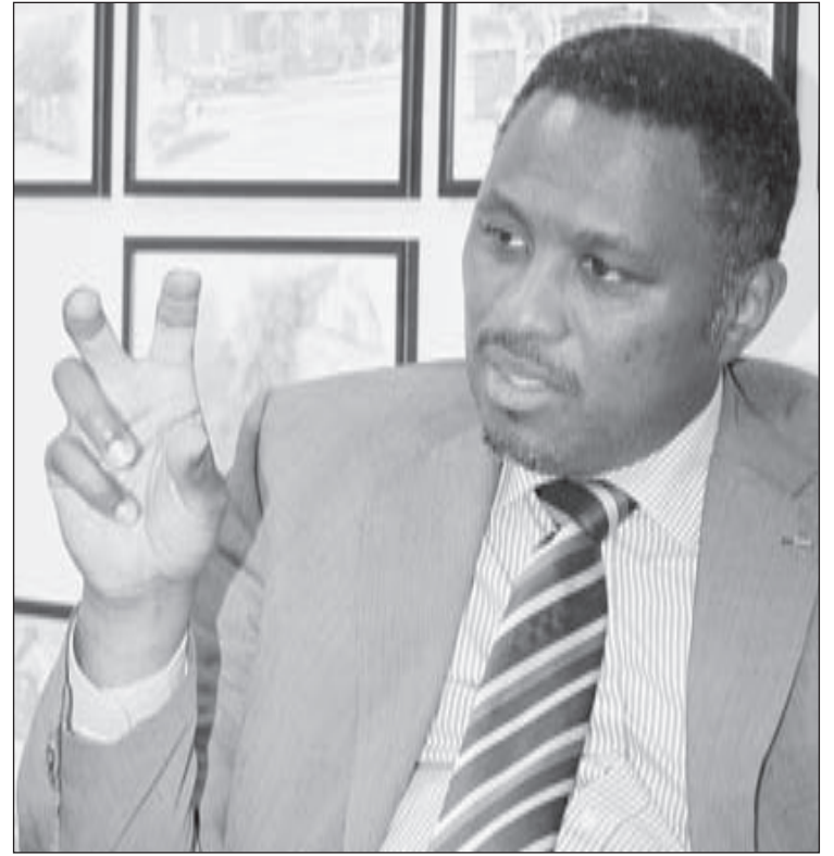
Minister sr. Arthur Dowers

E edificio aki ta traha for di añanan 1930. Awor aki ta pone un pida grandi adicional aden. Esaki ta pone cu e servicio cu brinda di husticia ta mas optimal, pero e condicion di trabou ta bira mucho mas miho. Minister di Husticia ta kere cu a pone hopi esfuerzo den e proyecto y ta spera cu dentro poco e proyecto ta completamente cla. Minister di Husticia sr. Arthur Dowers a indica cu tabata tin algun meerwerk cu a